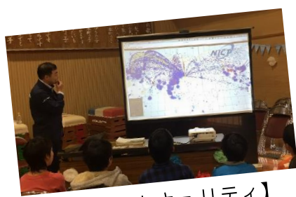
【サイバーセキュリティ】

2019年に開催した学びフェスは、本町小の保護者を講師として迎え6教室で開催しました。児童参加113名、保護者未就学児参加74名、総勢参加187名でした。BTCメンバーと応援し隊、多数のボランティアの方々との協力で創り上げることができました。